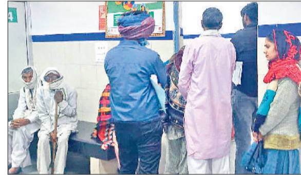
झज्जर। अस्पताल में मेडिसिन ओपीडी के बाहर लगी लोगों की भीड़।

करीब डेढ़ साल पहले सरकार ने मांग मानी थी लेकिन अब तक पूरी नहीं की। दोनों मांगें जायज हैं और उन्हें न माना जाना डॉक्टरों के साथ अन्याय है। इसलिए हड़ताल कर रहे हैं। लगभग 90 प्रतिशत डॉक्टर हमारे साथ हैं। बेशक सरकार ने एस्मा लगा दिया लेकिन हम हर स्थिति के लिए तैयार हैं। यह केवल मांग नहीं अब मान सम्मान की लड़ाई है। डॉक्टरों