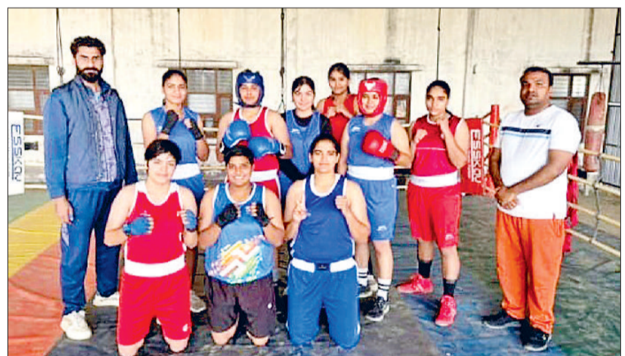
झज्जर। प्रशिक्षकों के साथ उपरिष्ठ जिला स्तरीय टीम की चयनित महिला मुक्केबाज।