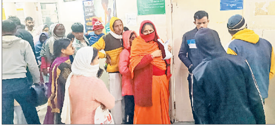
बहादुरगढ़। अस्पताल में अपने नंबर का इंतजार करते मरीज।

बुधवार को ओपीडी सहित कई वार्डों में भीड़भाड़ देखने को मिली। हालांकि वैकल्पिक व्यवस्था कर सेवाएं सुचारु जारी रखने का प्रयास प्रबंधन की ओर से किया जा रहा है लेकिन नियमित विशेषज्ञ डॉक्टरों की कमी खल रही है। ऑपरेशन व अल्ट्रासाउंड सहित कई तरह की सेवाएं प्रभावित हैं। अस्पताल में आए मरीजों ने कहा कि सरकार को रास्ता निकालकर हड़ताल समाप्त करानी चाहिए ताकि सेवाएं प्रभावित न हों। उधर, हरियाणा सिविल मेडिकल