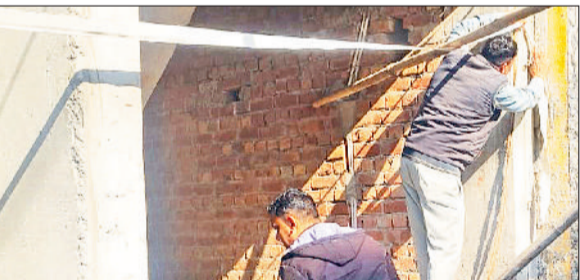
बहादुरगढ़। एमआईई में अनाधिकृत निर्माण को सील करते नप कर्मचारी।

टीम ने मौके पर दस्तावेजों की जांच की और पाया कि भवन निर्माण बिना प्लान की मंजूरी के चल रहा था। वहीं, विवेकानंद नगर में फैक्ट्री नियमों के विरुद्ध