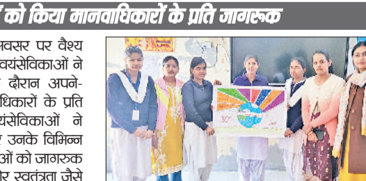
बहादुरगढ़। इंटर्नशिप के दौरान विद्यार्थियों को जागरूक करती भावी अध्यापिका।