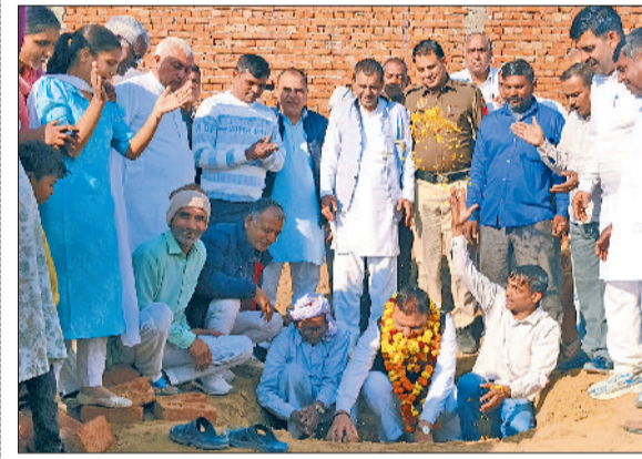
बहादुरगढ़। अंबेडकर भवन के निर्माण का शुभारंभ करते विधायक राजेश जून।

लाख रुपये की लागत आएगी। विधायक ने कहा कि यह प्रारंभिक चरण है और भविष्य में अतिरिक्त बजट लाकर यहां एक भव्य व पूर्ण सुविधाओं से युक्त भवन तैयार किया जाएगा। जिससे ग्रामीणों को सामाजिक, धार्मिक और सामूहिक कार्यक्रमों के लिए बेहतर स्थान उपलब्ध हो सकेगा। विधायक राजेश जून ने कहा कि सीएम नायब सिंह सेनी के सहयोग से बहादुरगढ़ विधानसभा क्षेत्र में विकास कार्य लगातार तेजी से हो रहे हैं।