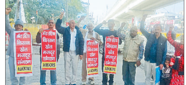
बहादुरगढ़। किसान नेता पर हुए हमले के विरोध में प्रदर्शन करते संगठन सदस्य।