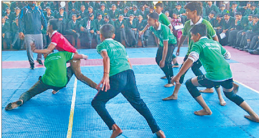
बहादुरगढ़। कबड्डी प्रतियोगिता में भाग लेते सेंचुरी स्कूल के विद्यार्थी।