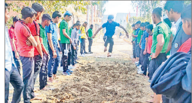
बहादुरगढ़। खेलकूद महोत्सव में लंबी कूद लगाता विद्यार्थी व ब्लोइंग द कप रेस में भाग लेती छात्राएं।