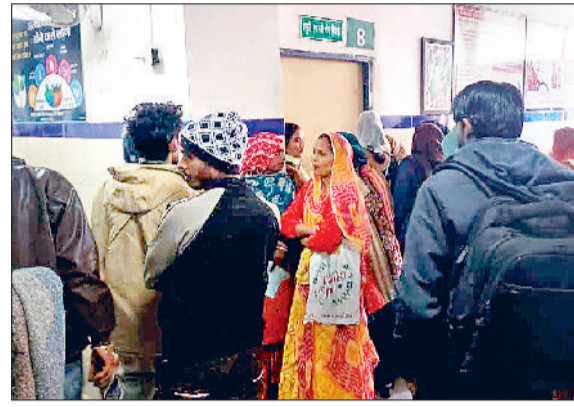
झज्जर। प्रसूति एवं स्त्री रोग ओपीडी के बाहर लगी महिलाओं की भीड़।