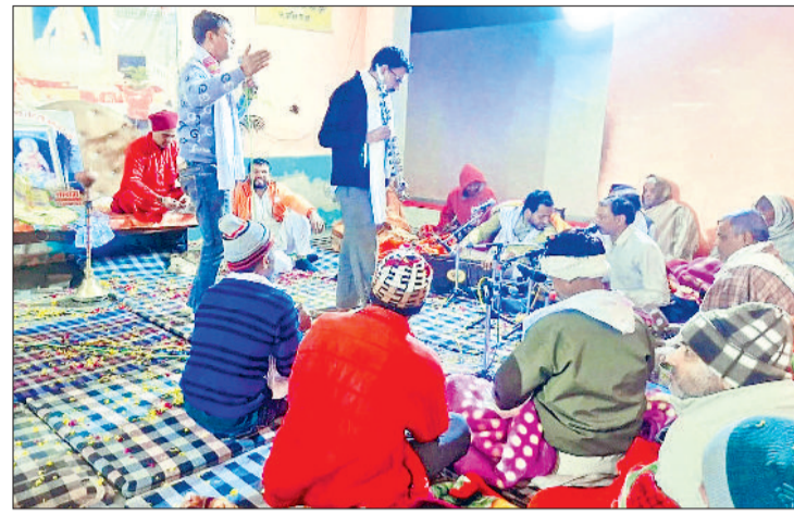
झज्जर। सत्संग के दौरान मधुर भजनों की प्रस्तुति देते हुए गायक कलाकार।