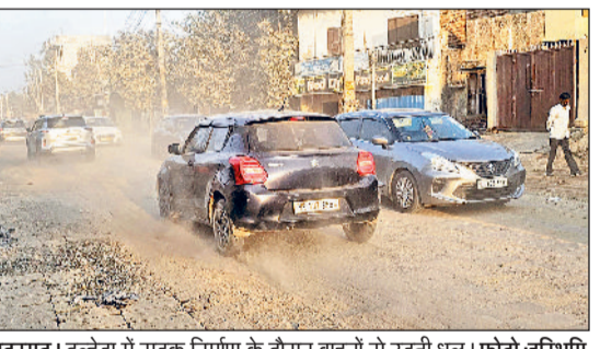
बहादुरगढ़। दुल्हेड़ा में सड़क निर्माण के दौरान वाहनों से उड़ती धूल।